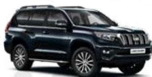
221 Modrá – tmavá hlbinná**