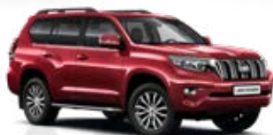
3R3 Červená – Barcelona*