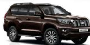
4X4 Hnedá – perleťová**