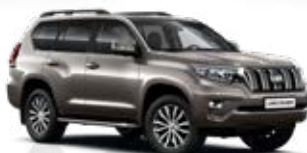
4V8 Bronzová – Avant Garde*