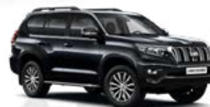
218 Čierna – klasická*