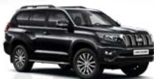
202 Čierna – hviezdna