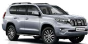
1F7 Strieborná – saténová*