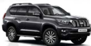
1G3 Sivá – popolavá*