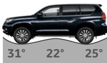
Predný nájazdový uhol, Prechodový uhol, Zadný nájazdový uhol