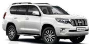
070 Biela – perleťová**